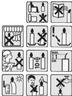
Eine "Gebrauchsanweisung" zur Benützung von Kerzen.